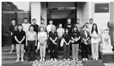
参加培训的新员工