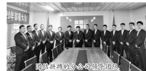
团结拼搏的分公司领导团队

自2006年开始,分公司每年定期从洛阳理工学院、郑州航空、河南科技大学等院校招聘各专业优秀毕业生,且优先录用品学兼优、吃苦耐劳的农村孩子,并提供必要的生活培训。新员工入职首先集中进十天的封闭式培训,由集团公司各部门专业人员以及分公司各岗位优秀管理人员授课,集训后分组分批分配到各个项目部,并安排有丰富经验的师傅“传、帮、带”,尽可能多的参与现场管理,在最短的时间里了解工程项目施工流程及公司管理制度与文化。三个月后结合各自师傅对他们的评价以及每个人的自我认识,分配到不同的岗位上独立工作,由主管人员从旁监管。一年后再根据实际表现重新定岗,择优提拔到楼栋长、片区负责人等关键岗位上,两年以后根据他们的业绩表现,经主管领导推荐担任生产经理或项目各科室负责人,再用两年的时间择优提拔一批表现突出的青年员工,担任项目执行经理或者项目经理,为其提供更大的平台,进入分公司中层领导序列。(下转3版)