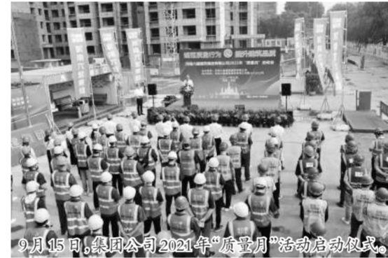
9月15日,集团公司2021年“质量月”活动启动仪式。

随后全体与会人员进行“质量月”签字并有序对施工现场质量标准化展示样板、“质量月”宣传展板等进行观摩交流。(质量部/文)