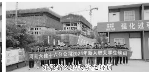
开展新入职大学生培训