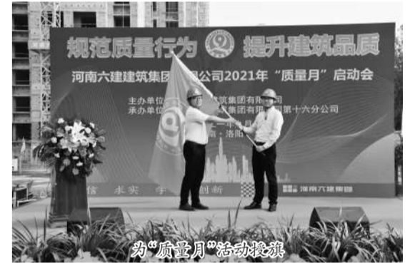
为“质量月”活动授旗