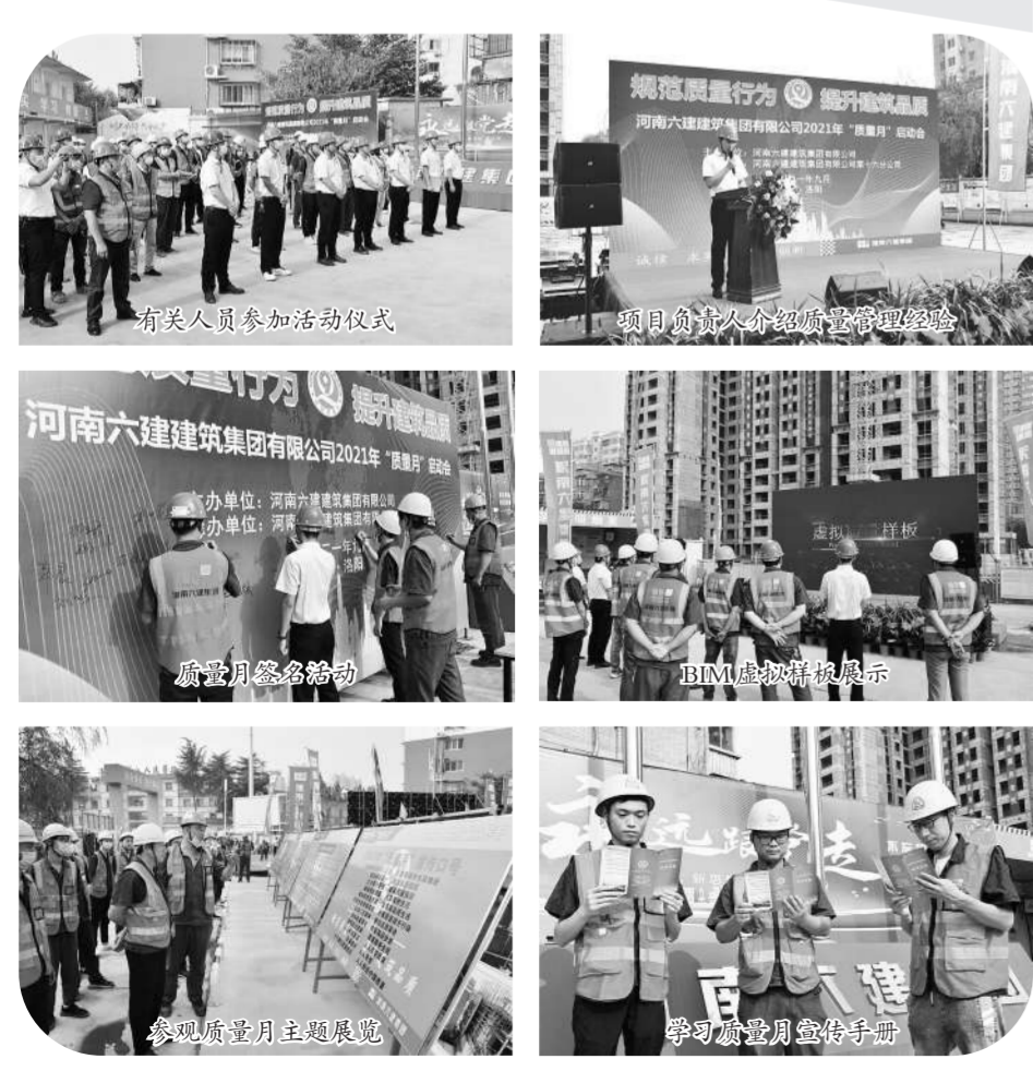
有关人员参加启动仪式 项目负责人介绍质量管理经验 质量月签名活动 BIM虚拟看板展示 参观质量月主题展览 学习质量月宣传手册