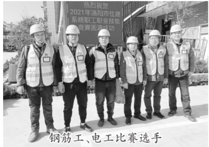
钢筋工、电工比赛选手