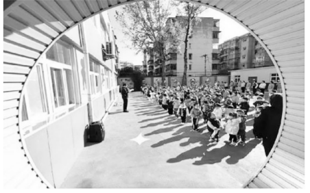
幼儿园举办2021消防安全演练活动

青春的力量给予我火红的热情,我用似火的热情奋斗在一线,青春无悔。今后我会踏踏实实立足岗位,抓住发展机遇,发挥聪明才智、奋发有为,将自身的奋斗融入时代发展的洪流之中,为国家和城市建设贡献青春力量,在与时俱进的发展中实现自身价值。在岗位上发挥青年先锋作用,团结带领分公司全体青年助力企业发展,奋力为实现洛阳副中心城市建设和生产“双倍增”目标而努力奋斗。