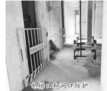
电梯回和洞口防护