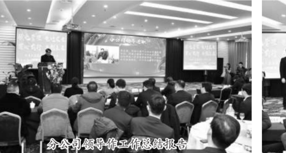
分公司领导作工作总结报告