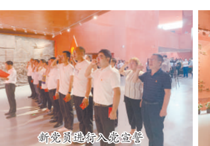
新党员进行入党宣誓