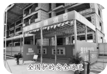
全国护的安全通道