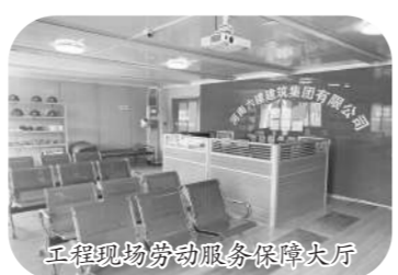
工程现场劳动服务保障大厅