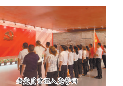
老党员重温入党誓词