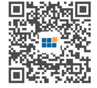
河南六建微信公众号(扫码关注)