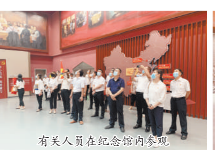
有关人员在纪念馆内参观