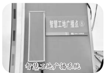
智慧工地广播系统