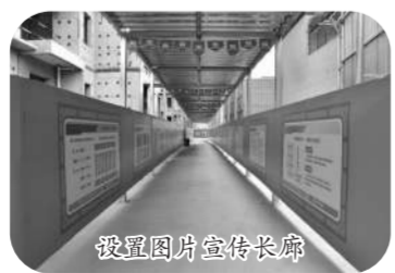
设置图片宣传长廊