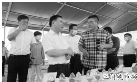
三门峡市领导莅临观摩会

7月6日下午,河南省三门峡市城乡一体化示范区管委会组织,在集团公司施工的三门峡高新区绿色制造产业园项目现场举行项目观摩会议。观摩会由三门峡城乡一体化示范区党工委书记胡志权主持召开,三门峡市委书记、市人大常委会党组书记刘南昌出席会议,指导工作。三门峡高新区绿色制造产业园项目是由三门峡高新区与苏州纳米所联合打造,是国家工信部支持的绿色制造产业,项目的实施将带动高新区物流运输等第三产业的发展,对推进三门峡高新技术产业开发区、国家绿色产