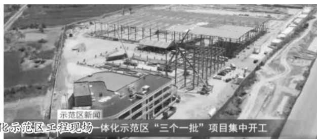
三门峡市城乡一体化示范区工程现场

2022年6月,是第21个全国“安全生产月”,市场围绕“遵守安全生产法,当好第一责任人”主题,扎实开展了形式多样的主题活动,在全市场营造“人人讲安全、处处抓安全”的良好氛围,取得了较好效果。