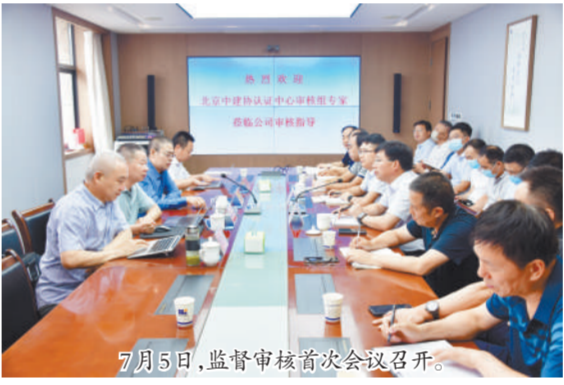
7月5日,监督审核首次会议召开。