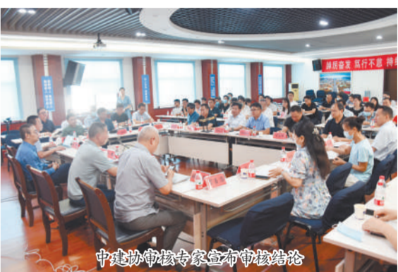
中建协审核专家宣布审核结论