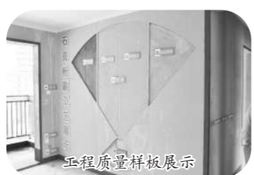
工程质量样板展示