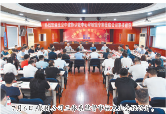
7月6日,集团公司三体系监督审核本次会议召开。

审核组通过交谈、查阅(证据、依据)、现场巡察等方式对集团公司领导、员工代表及企业发展管理部、工程项目管理部、技术管理部、质量管理部、安全环境管理部、保卫部等6个职能部门和河南洛阳工业园区标准化厂房及配套建设EPC项目、建业旭辉尊府项目一标段总承包工程2个项目部的管理体系运行有效性、符合性进行了认真细致的审核。