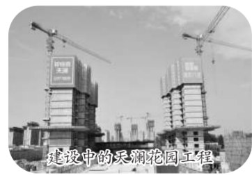
建设中的天澜花园工程