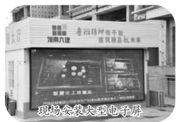
现场安装大型电子屏