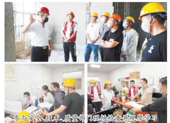
参与安全、技术、质量部门现场检查并观摩学习