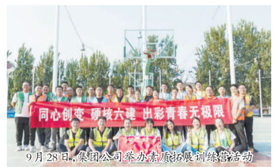
9月28日,集团公司举办素质拓展训练营活动

查并进行现场观摩学习,随后进行了知识竞答活动,通过趣味游戏以及激烈的抢答环节,检验了大家专业技术知识水平,部门人员的点评使青年员工对相关知识有了更加深刻的理解和掌握。户外活动同样精彩纷呈,大家进行了趣味接力、合力建塔、N人N足、穿针引线、才艺展示等项目,获胜队伍还收获了精美奖品,在欢声笑语中增进了各项目青年人员之间的友谊,培养了团队协作精神。青年员工纷纷表示,参加素质拓展训练营活动,能够充分感受到公司良好的企业文化氛围,对自身专业知识提升也有很大助益,今后将不断学习、创新,立足本职,更好地完成各项工作任务。集团公司将持续开展系列团建活动,增强企业凝聚力,激发青年员工的工作热情,在企业高质量发展过程中展现青春力量。(团委)