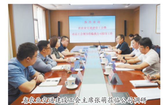
省农业交通建设工会主席张萌在临公司调研

省、市总工会领导首先参观了公司荣誉室,并在五楼会议室进行座谈交流。金跃山董事长介绍了企业的基本情况,并表示:河南六建将一如既往地坚持正确的企业文化价值观,依靠强大履约能力和良好的企业信誉赢得市场,勇于承担社会责任,展现六建担当。工会主席常康延汇报了集团公司工会及省建筑安装企业工会联委会主要工作开展情况。张萌主席主要就工会组织建设及工会结合企业实际情况服务好企业中心工作等进行了交流,她指出:省总工会将大力开展有针对性、倾向性的、受职工群众欢迎的各项工作。我们到基层企业调研,了解企业需要什么、职工需要什么,就是为了更好地凝聚职工、找到工作契合点,调动职工积极性,企业发展好了,每个职工才能受益。张萌主席一行对集团公司当前形势下取得的各项成绩给予了充分肯定,并希望河南六建能够在今后发展中再创佳绩。(工会)