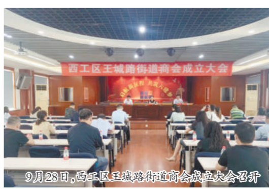
9月28日,西工区王城路街道商会成立大会召开