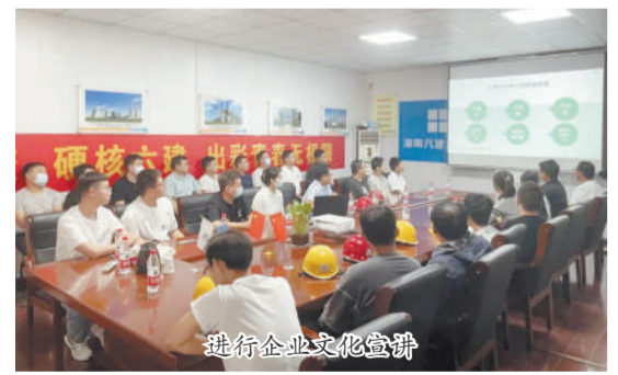
进行企业文化宣讲