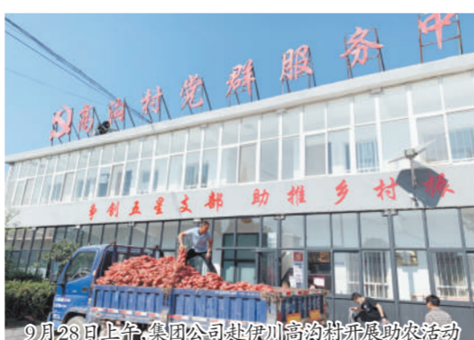
9月28日上午,集团公司赴伊川高沟村开展助农活动

9月28日上午,集团公司相关人员来到伊川县鸭岭镇高沟村,开展爱心助农活动,帮助该村解决困难农户红薯销售难的问题,采购了六千多斤红薯,解了薯农的燃眉之急。集团公司近年来持续开展此项活动,积极践行社会责任,传递企业爱心,关注高沟村乡村发展情况,得知今年红薯又取得了丰收,销售存在一定困难后,立即行动前往采购,爱心帮扶困难农户,为助推乡村振兴贡献一份力量。(工会)