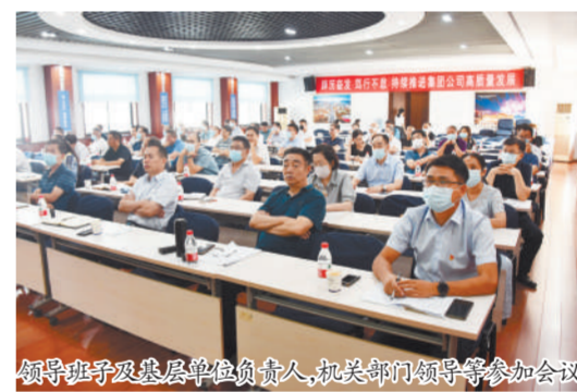
领导班子及基层单位负责人、机关部门领导等参加会议