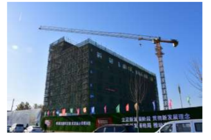
省质量标准化示范工地——中南高科·洛阳智能装备创新港项目