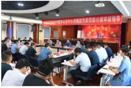
7月5日—6日,中建协认证中心对集团公司三管理体系进行监督审核