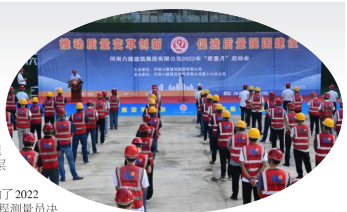
9月16日,集团公司举办2022年“质量月”活动启动仪式