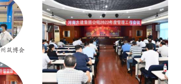
9月16日,集团公司召开专题管理工作会议