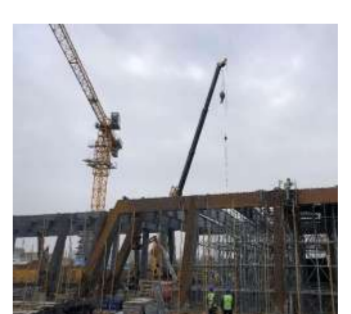
建设中的洛阳九州池二期工程