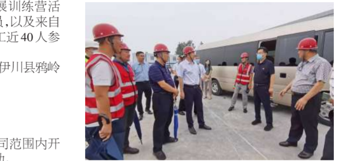
9月3日,洛阳市副市长李新红(右二)等领导视察杨湾学校项目