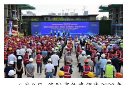
6月9日,洛阳市住建领域2022年“安全生产月”启动仪式在天瀾花园项目现场举行