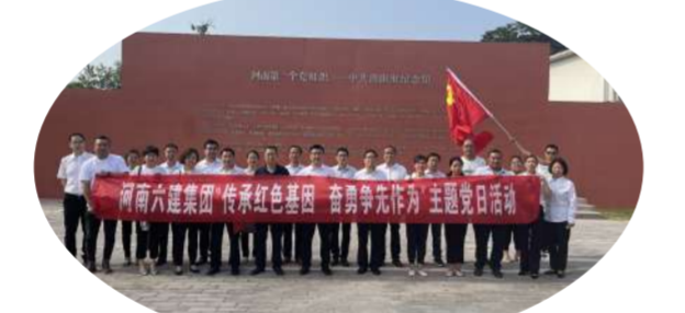
7月1日,集团公司党委在“中共洛阳组纪念馆”开展主题党日活动

●7月1日,集团公司党委在“中共洛阳组纪念馆”开展“传承红色基因,奋勇争先”主题党日活动。 ●7月5日—6日,北京中建协认证中心专家组对集团公司质量管理体系、环境管理体系、职业健康安全管理体系进行了为期两天的监督审核,审核组一致认为集团公司管理体系符合标准要求,整体运行有效,推荐通过本次监督审核。 ●7月,集团公司被西工区委、区政府授予2021年度税收工作突出贡献奖。集团公司已连续多年获得区税收工作突出贡献奖。 ●7月21日,集团公司开展“夏送清凉,传递关爱”慰问一线员工活动。