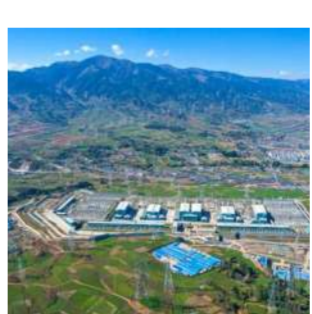
建设中的白鹤滩二期换流站工程