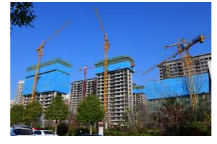
省质量标准化示范工地——新安县正锦水岸项目