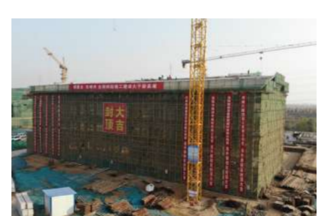
建设中的杨湾学校