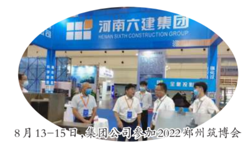
8月13—15日,集团公司参加2022郑州筑博会

●11月,针对疫情防控形势复杂多变给项目建设带来较大挑战和重点工程项目工期紧、任务重的形势,集团公司一手抓疫情防控,一手抓项目建设,统筹推进疫情防控和重点项目实施。在洛阳市南山大道西延二期建设工程,洛阳九洲池遗址保护展示工程二期项目,洛阳市外国语学校(杨湾学校),焦作市人民医院门急诊及医学研究中心项目,白鹤滩二期换流站土建C包工程等建设中,取得了阶段性成果。 ●11月,集团公司获评洛阳市2022年上半年建设领域诚信“红名单”企业。(下转4版)