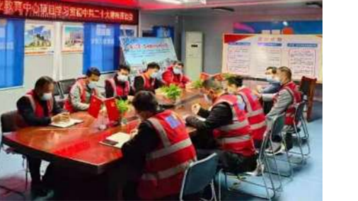
组织开展学习贯彻党的二十大精神活动