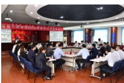
4月29日,集团公司召开青年分享座谈会