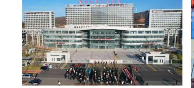
12月1日,集团公司承建的汝阳县人民医院新院区工程落成投用