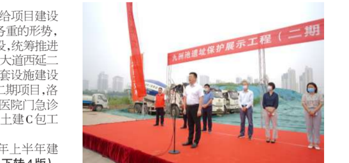
9月3日,集团公司承建的洛阳城九州池二期项目开工