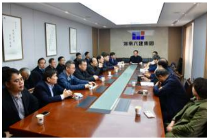
3月8日,集团公司2022年度股东会召开