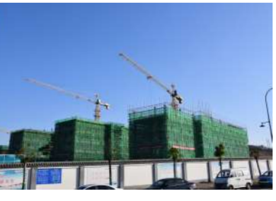
省质量标准化示范工地——新安县第二职业教育中心项目