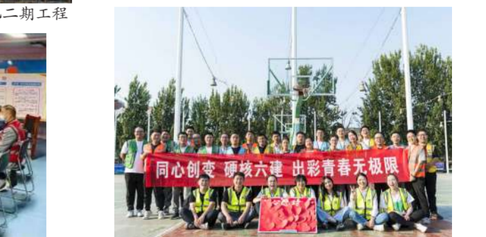
9月28日,集团公司举办素质拓展训练营活动