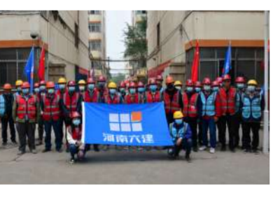
5月,集团公司会战洛阳市防疫隔离点项目的改造建设

●5月,洛阳市安全生产委员会授予集团公司“2021年度洛阳市安全生产先进单位”。 ●5月8日开始,集团公司会战洛阳市防疫隔离点项目的改造建设,由26个土建、安装分公司参加会战,经过全力攻坚,以最短的时间、最好的质量、最优的标准完成46863.68平方米面积的1100余个房间改造任务。