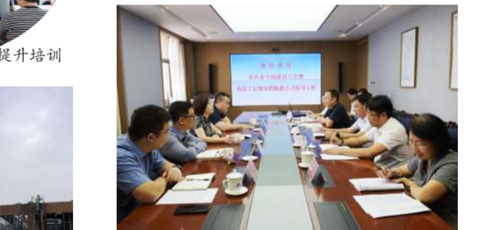
9月16日,省总工会农业交通建设工会主席在公司调研工作