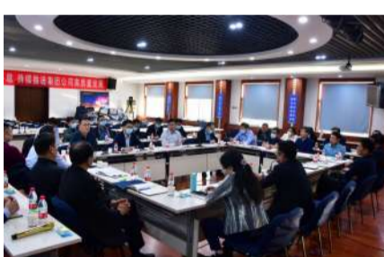
4月13日,集团公司召开专题办公会议