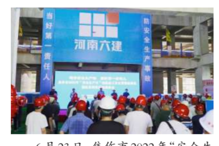
6月23日,焦作市2022年“安全生产月”观摩会在焦作市人民医院项目现场举行