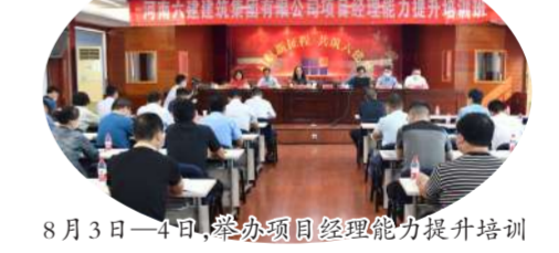
8月3日—4日,举办项目经理能力提升培训