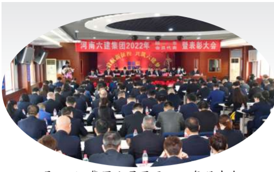
3月11日,集团公司召开2022年股东会暨会员代表大会