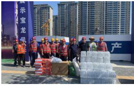
7月21日,集团公司开展“夏送清凉”活动