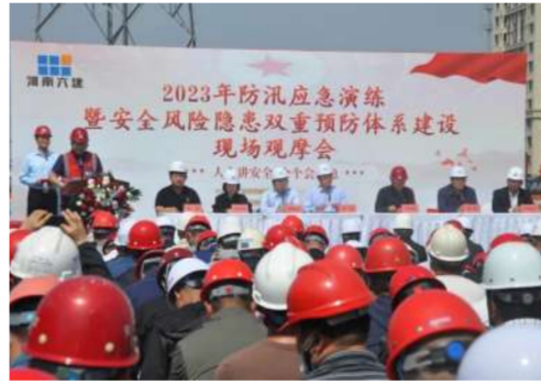
5月9日,公司新开普智能制造产业基地项目举办郑州市城乡建设领域2023年防汛应急演练暨安全风险隐患双重预防体系建设观摩会。