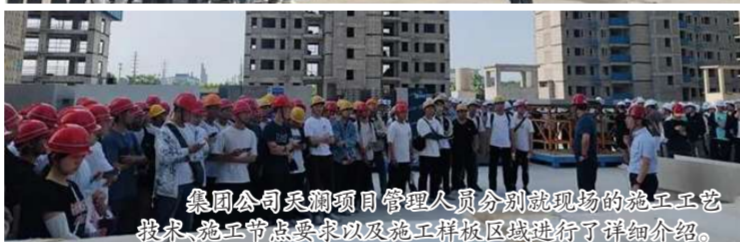
集团公司采购项目管理人员分别就现场的施工工艺要求、施工节点要求以及施工样板区域进行了详细介绍。