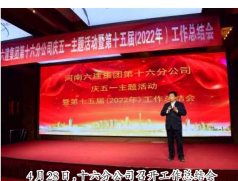
4月28日,十六分公司召开工作总结会