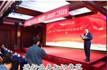
进行业务知识抢答