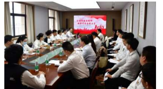
5月4日,公司团委举办“庆五四”主题团日活动。