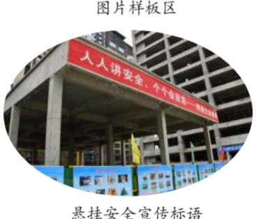
悬挂安全宣传标语