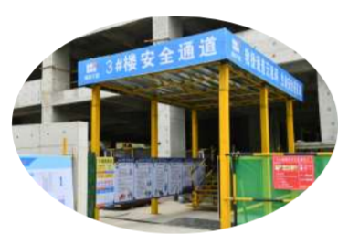
安全通道标准化设置